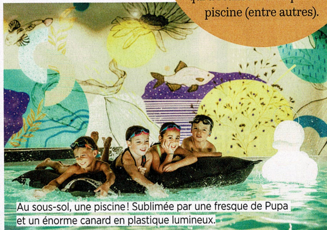
Au sous-sol, une piscine! Sublimée par une fresque de Pupa et un énorme canard en plastique lumineux.