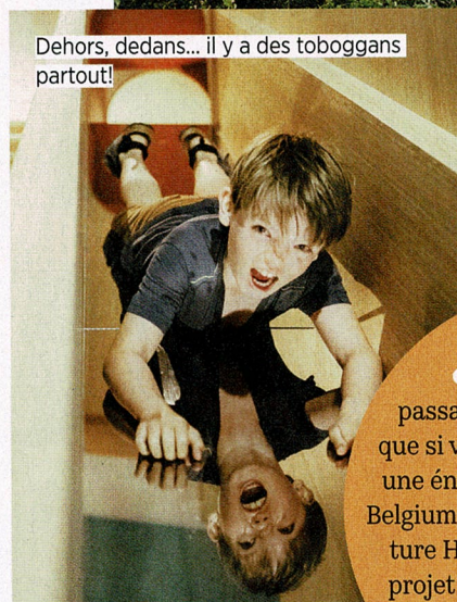
Dehors, dedans... il y a des toboggans partout!